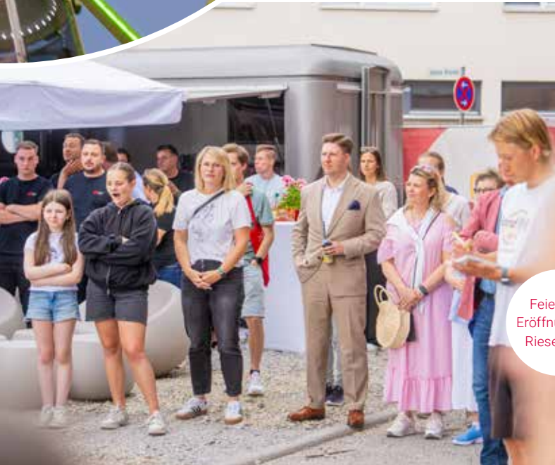
Feierliche Eröffnung des Riesensrads