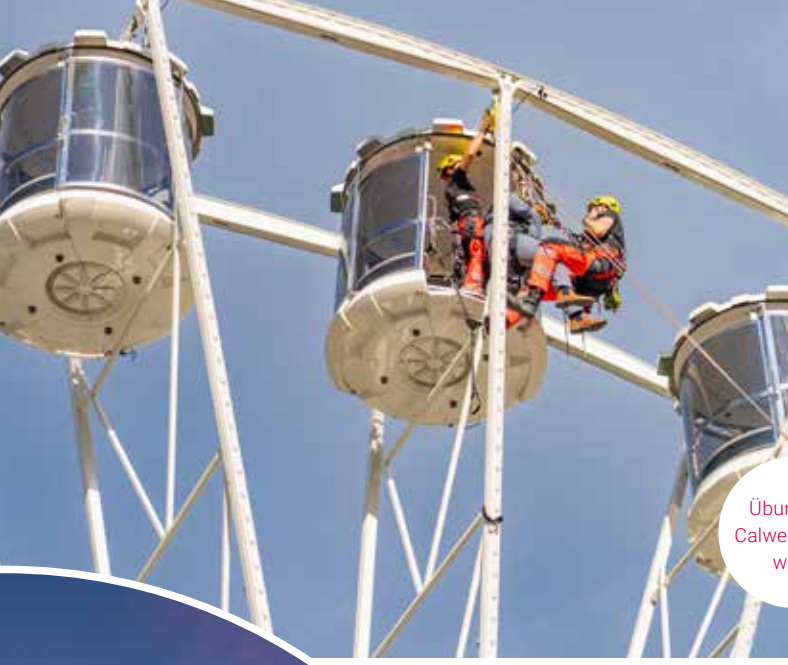
Übung der Calwer Feuer- wehr