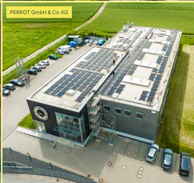
PERROT GmbH & Co. KG